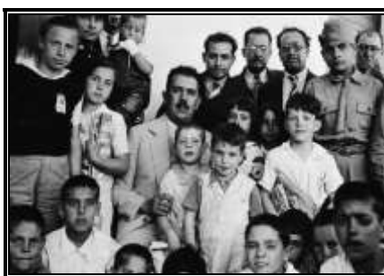
El Presidente Lázaro Cárdenas, con algunos de los niños españoles refugiados recién llegados a México.