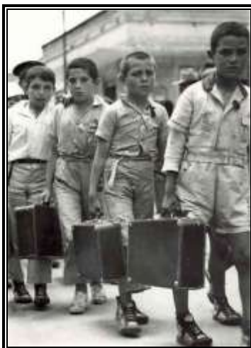
Los "Niños de Morelia" desembarcando en Méjico.

El mensaje de Cárdenas a Luis I. Rodríguez fue el siguiente: