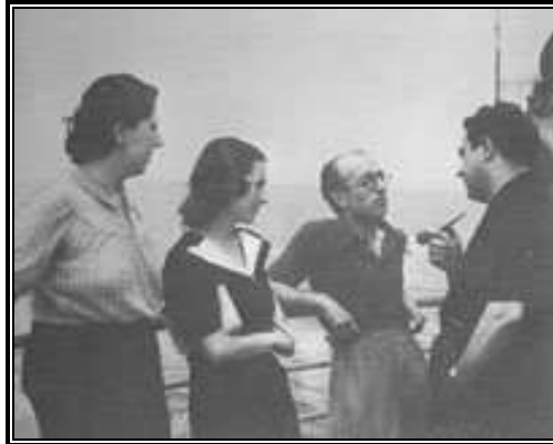
El "Sinaia", primer gran barco de emigrados españoles hacia México.

(nuevamente con Alcalá Zamora a bordo), etc., etc., todos los cuales sirvieron para llevar a América a miles y miles de refugiados, bastantes de los cuales tuvieron puntos de destino diferentes a México , tales como Nueva York, Argentina o la República Dominicana .