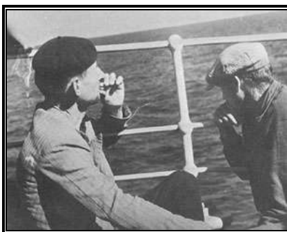
Refugiados españoles embarcados hacia México.

Asimismo, de aceptar el gobierno francés sugiera usted la forma práctica para realizar estos propósitos en la inteligencia de que en atención a las circunstancias nos dirigimos a los gobiernos alemán e italiano comunicándoles nuestro deseo. Conteste urgentemente. Presidente Cárdenas"